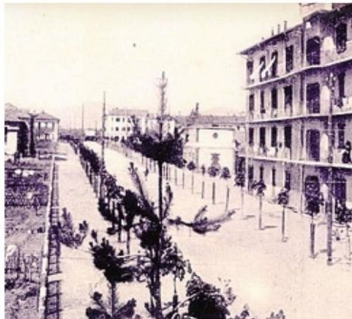
Il villaggio operaio lungo viale Somaini