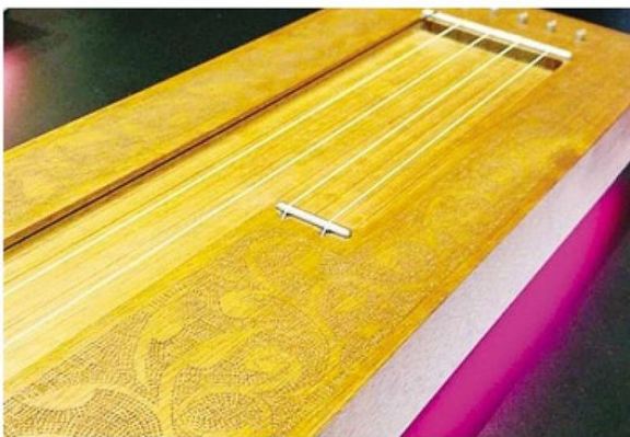
La lampada è un esempio delle possibili declinazioni di IoT